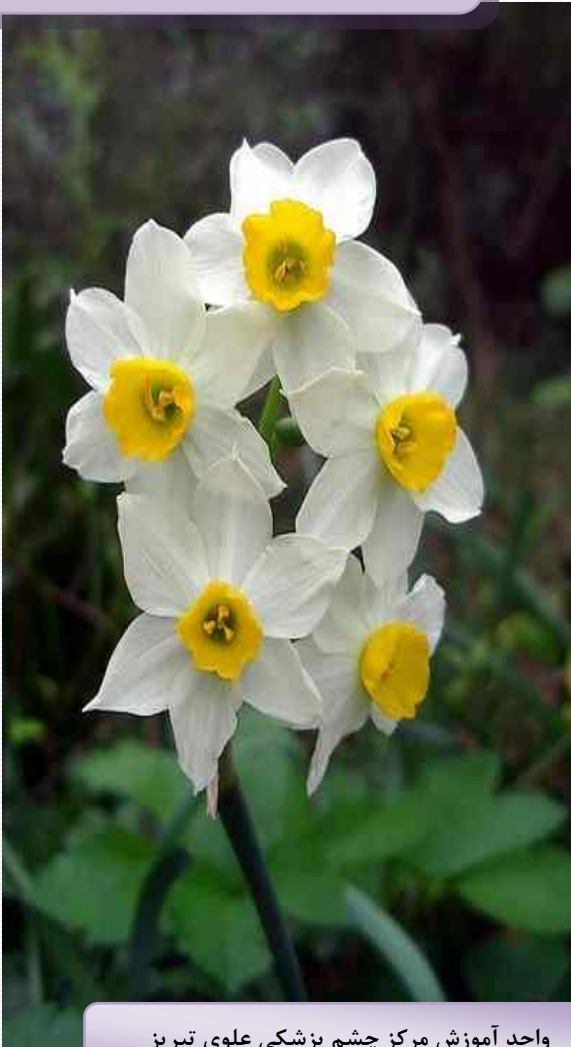
واحد آموزش مرکز چشم پزشکی علوی تبریز

چیزی بخورید. اما اگر فردای روز بستری عمل خواهید شد می‌توانید بعد از خونگیری غذا میل کنید. - در بخش جراحی، موقع بستری، از بیماران بالای ۴۰ سال نوار قلبی تهیه می‌شود.